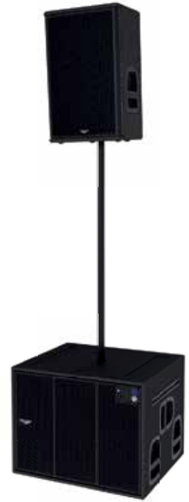
低频音箱上支柱安装